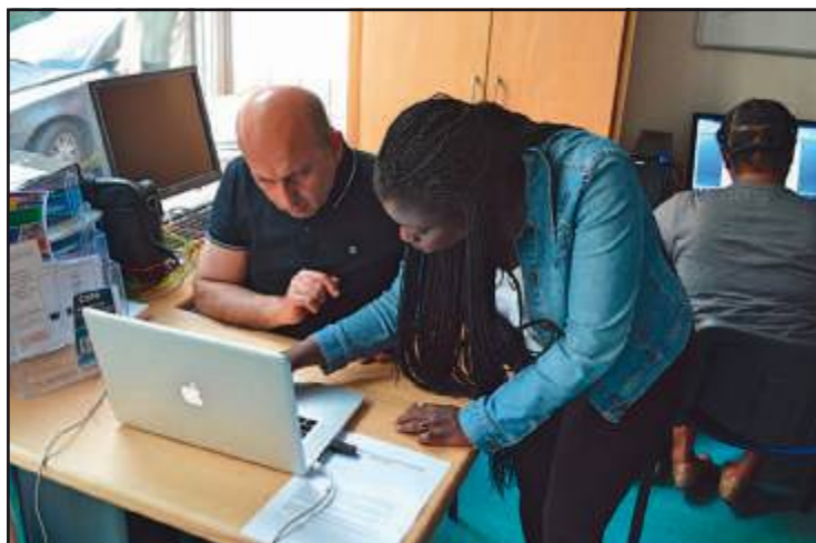
Les formations débutent le 2 juin.

L'association Konexio, certifiée organisme de formation et labellisée Grande École du Numérique organise à partir du mercredi 2 juin prochain des formations au numérique au coworking de l'Arrêt-Minute dans les locaux de la Maison Graziana à Libourne. Ces sessions sont dédiées aux publics fragiles et vulnérables afin de lutter contre l'exclusion numérique. L'association le précise dans un communiqué de presse : « En France, 40 % de la population n'est pas autonome dans ses usages numériques : 7 % est totalement exclue, 19 % a un statut débutant à intermédiaire, 14 % dispose d'une bonne maîtrise mais n'utilise jamais les outils numériques par peur de se tromper ».